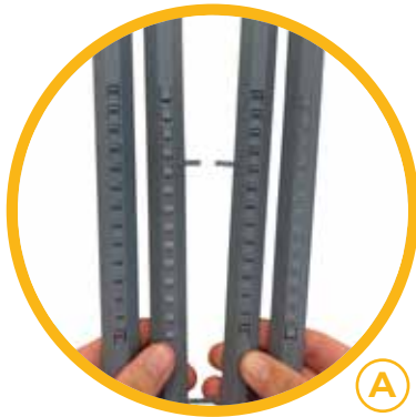
FOTO DI RIFERIMENTO - REFERENCE PHOTOS - PHOTOS DE RÉFÉRENCE PRODUKTBILDER - FOTOS DE REFERENCIA